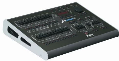
ADB Domino 48